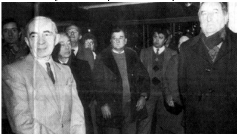
Une manifestation suivie par de nombreuses personnalités

Depuis hier, une nouvelle page de l'histoire de, la maison installée dans la vallée de la Bièvre est