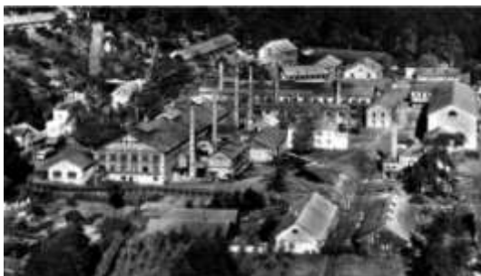
La Cristallerie de Vallerysthal au début du XX e siècle

Après de nombreuses difficultés et une crise structurelle, le dernier four de la cristallerie de Vallerysthal-Portieux s'est éteint en septembre 2012.