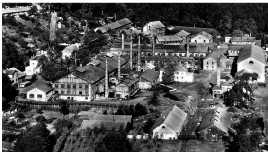
La Cristallerie de Vallerysthal au début du XX e siècle

Après de nombreuses difficultés et une crise structurelle, le dernier four de la cristallerie de Vallerysthal-Portieux s'est éteint en septembre 2012.