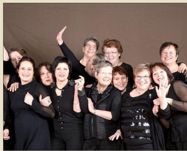
L'exposition artistique sera agrémentée d'un concert dimanche avec le chœur Féminin pluriel.

L'entrée sera libre, un plateau circulera.