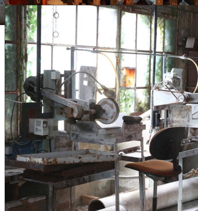
Si aujourd'hui les machines sont abandonnées à la corrosion, il faut s'imaginer une époque à laquelle la cristallerie fonctionnait 24/24 h. Une véritable ruche, chaude et bruyante, où des familles entières ont travaillé sur plusieurs générations.

Avant que les sept fours de Vallerysthal ne s'éteignent, que les mailloches et pontils ne soient raccrochés, la cristallerie a fourni toutes les cours royales d'Europe. Aujourd'hui, certaines de ses pièces sont encore rééditées pour des palais. La production se fait à partir des moules originaux, mais à La Rochère ou dans un pays d'Europe pour les grosses séries. Sur place, il ne reste de ce faste que le magasin, une partie des anciens ateliers qui se visite et un petit four autour duquel trois artisans se relaient encore pour confectionner de minuscules animaux et figurines de cristal auxquels ils insufflent un peu de l'âme des verriers de la vallée.