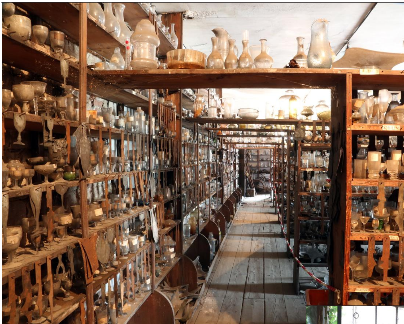
Près de 30 000 modèles et gabarits associés sont entreposés dans les greniers de la cristallerie de Vallerysthal, inaccessibles au public, comme figés depuis l'arrêt de la production en 1996.

En 1895, au plus fort de son activité, la cristallerie de Vallerysthal employait jusqu'à 1400 personnes. Les villages de Vallerysthal et Sitifort ont été construits pour accueillir ces populations.