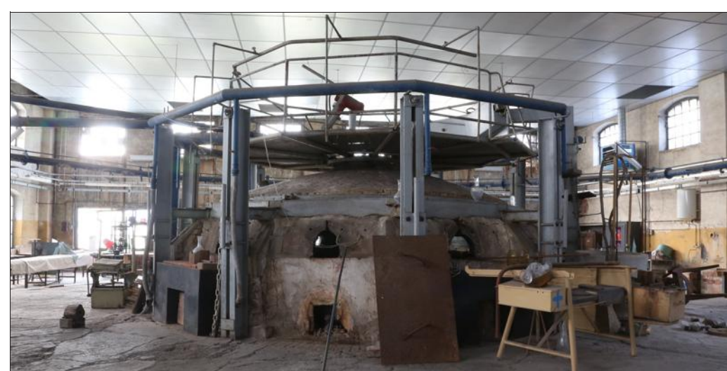
La cristallerie de Vallerysthal a compté jusqu'à sept fours, chacun ayant plusieurs entrées. Un poste de verrier pouvait produire 700 pièces par jour.

Les moules en bois sont devenus inutiles. Mais l'Association de sauvegarde du patrimoine verrier de Vallerysthal-Portieux, créée en 2012, milite pour que ces témoignages du savoir-faire des verriers de la vallée de la Bièvre ne tombent pas dans l'oubli.