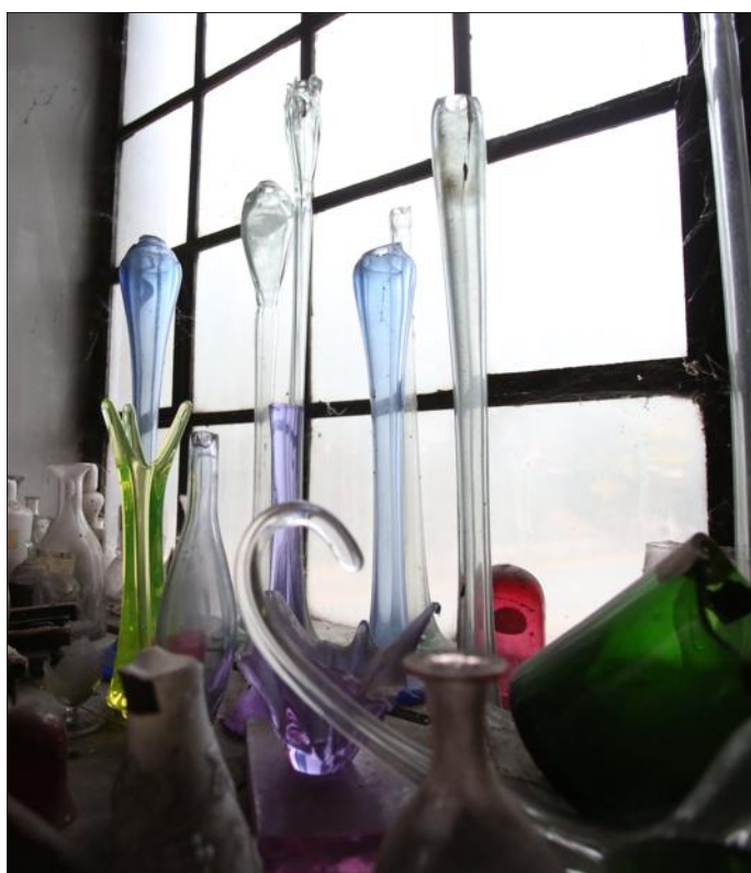
À Vallerysthal, le cristal le plus pur se parait parfois de superbes couleurs.

À la lumière d'une lampe de poche, dans les greniers de l'ancienne cristallerie de Vallerysthal, une clé ouvre une porte hors d'âge. Le panneau de bois s'entrouvre, récalcitrant, et dévoile un véritable trésor. Parfaitement alignés sur des étagères fluettes, 30 000 modèles de pièces produites dans cette usine entre 1838 et 1996 attendent. Leur éclat est terni par l'épaisse couche de poussière qui les recouvre. Certains ont été brisés sous l'action d'un courant d'air ou de quelques rongeurs. Tous ont encore leur étiquette avec le nom et la référence du modèle, souvent écrits à la main, en français ou en allemand selon l'époque à laquelle l'un des milliers d'ouvriers passés par là les ont façonnés.