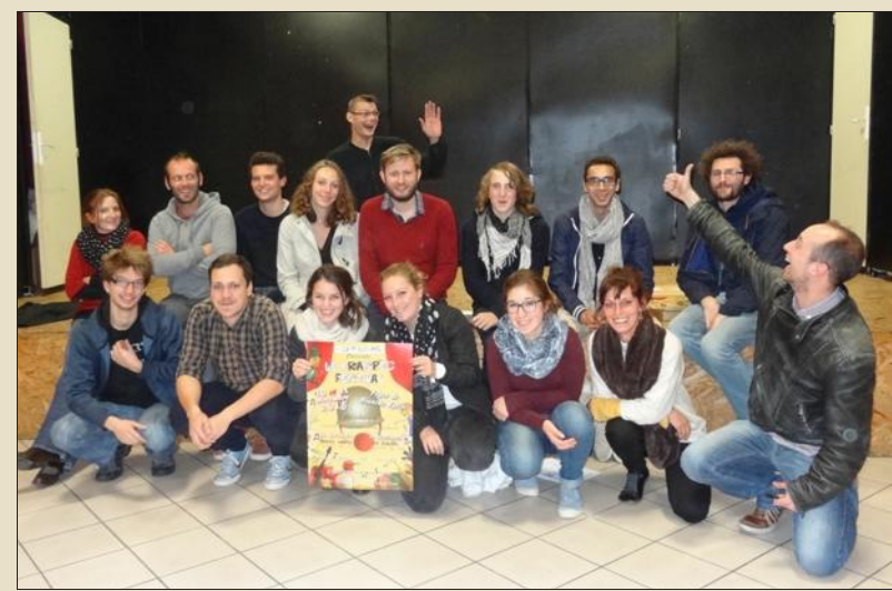
Encouragée par son succès de l'an passé, la troupe remontera sur scène pour son nouveau festival.