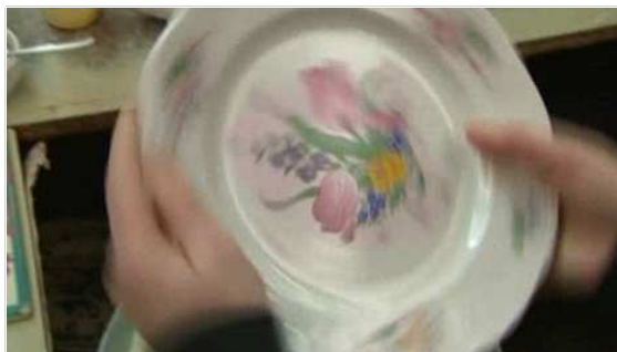
Une assiette en faïence de Lunéville France Télévisions Lorraine

Le groupe Faïence et Cristal connaîtra son repreneur cet après-midi